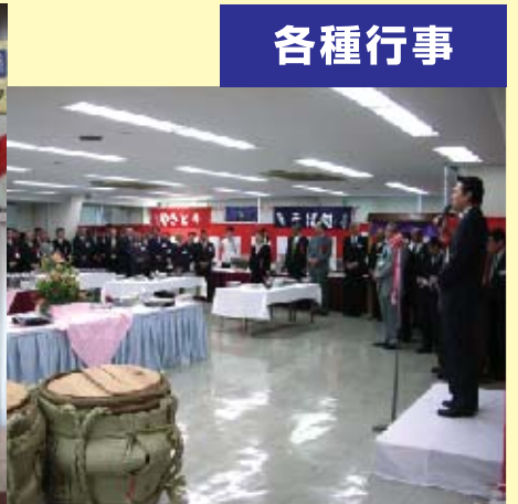
■東京小売販組新年会