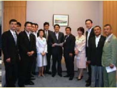
■平和靖国議連官房長官要望訪問