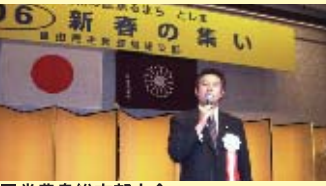
■党豊島総支部大会