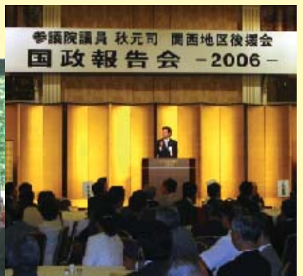
■国政報告会(関西後援会)