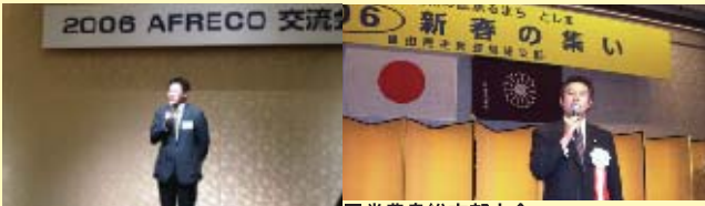
■アフリカ開発協会シンポジウム