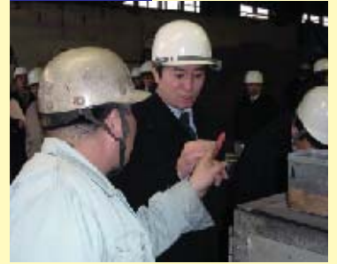
■鋳物工場視察(予算委員会)