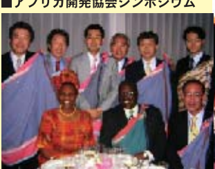
■ケニア大使館にて