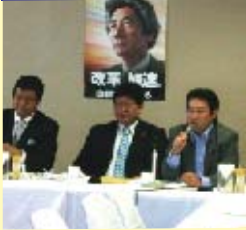
■日台若手議連意見交換会