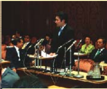
■行政改革特別委員会にて