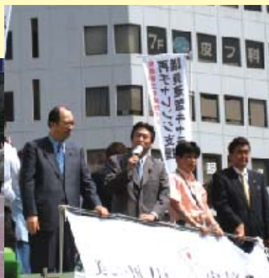
■党総裁選(安倍応援隊)