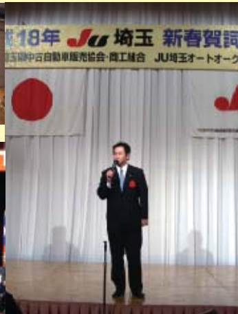
■J.U.埼玉新春賀詞交歓会