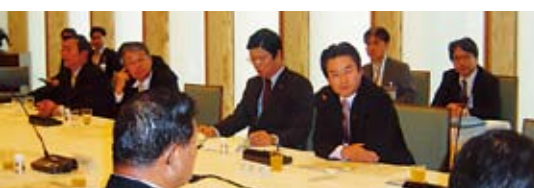
■第3回大臣政務官会議