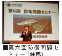
■第六回防衛問題セミナー(練馬)