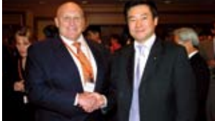
■IIS50周年記念 レセプション、アーミテージ元国務副長官と