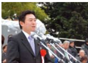
■第1師団創立46周年・練馬駐屯地創立57周年記念行事祝祭(訓辞)