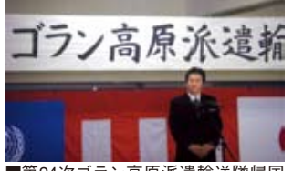
■第24次ゴラン高原派遣輸送隊帰国関連行事(訓辞)