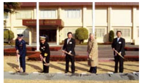
■航空自衛隊総隊司令部横田移転推進式典