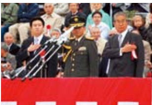
■第1師団創立46周年・練馬駐屯地創立57周年記念行事祝祭 栄誉礼