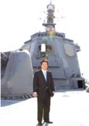
■出港行事「佐世保」(イージス艦)