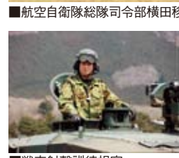
■戦車射撃訓練視察