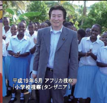
平成19年5月 アフリカ視察 「小学校視察(タンザニア)」