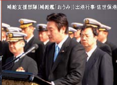
補給支援部隊(補給艦「おうみ」)出港行事・佐世保港