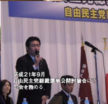
平成21年9月 自由民主党総裁選挙公開討論会にて 司会を務める