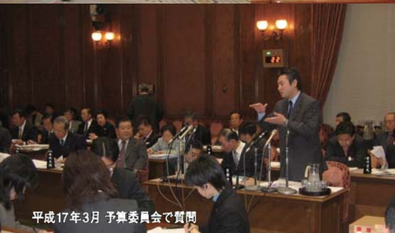
平成17年3月 予算委員会で質問