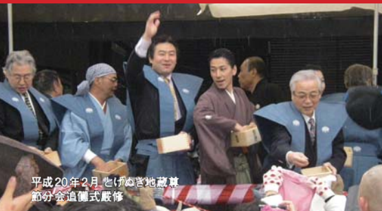
平成20年2月 与野党地蔵尊 節分会追儀式厳修