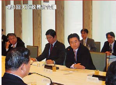
第3回大臣政務官会議