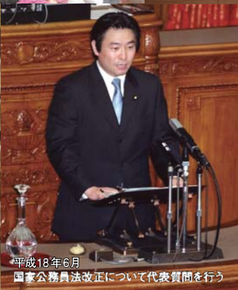
平成18年6月 国家公務員法改正について代表質問を行う