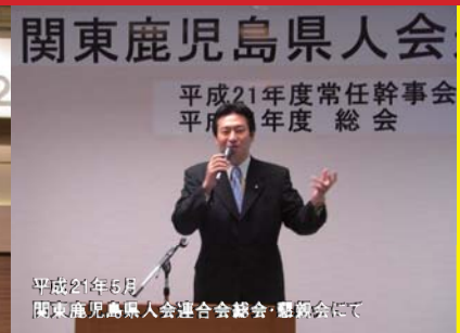
平成21年5月 関東鹿児島県人会連合会総会・懇親会にて