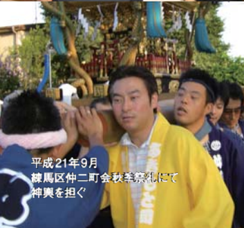
平成21年9月 練馬区仲二町会秋季祭りにて 神輿を担ぐ