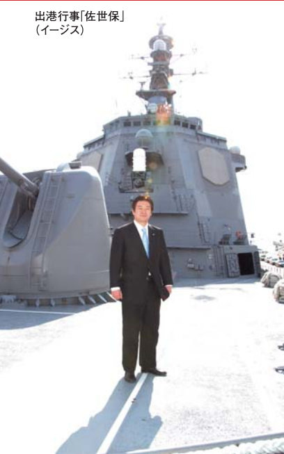
出港行事「佐世保」 (イージス)