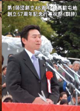
第1師団創立46周年・横馬駐屯地 創立57周年記念行事祝賀(副辞)