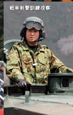
戦車射撃訓練視察