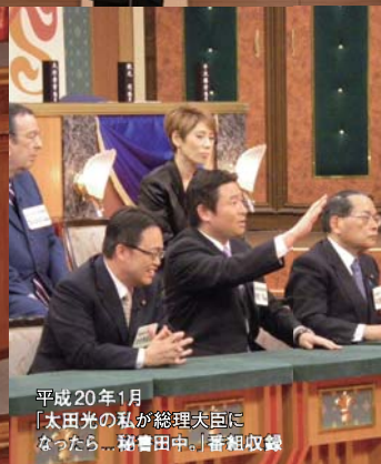
平成20年1月 「太田光の私が総理大臣になったら...秘書田中。」番組収録