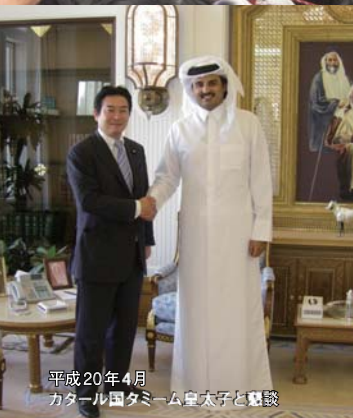
平成20年4月 カタール国タミム皇太子と懇談