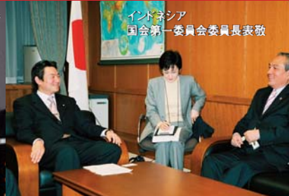
インドネシア 国会第一委員会委員長表敬